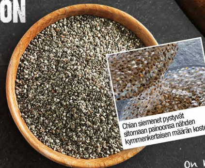
Chian siemenet pystyvät alustaan paksuuden näiden kymmenkertaisen määrän koostaan

Luonnollinen kasviliima parantaa ruoansulatusta ja auttaa ruokaa kulkemaan suoliston läpi. Kylläisyyden tunne ilman kehon kuormitusta Sisältää 20% omega-3 rasvahappoja terveen ihon ja turkin hyvinvointia varten.